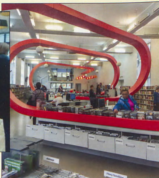
Zamojscy bibliotekarze w bibliotekach Wrocławia i Oświęcimia