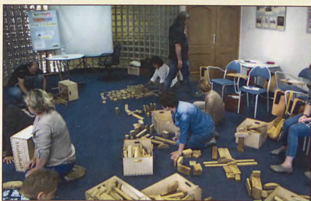
Warsztaty twórczej pracy z bajką