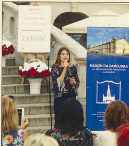
Narodowe Czytanie w Zamościu