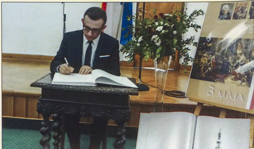
Obchody 100-lecia odzyskania Niepodległości - Księga wpisów