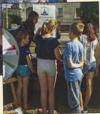
Książnica Zamojska na Wędrującej Estradzie