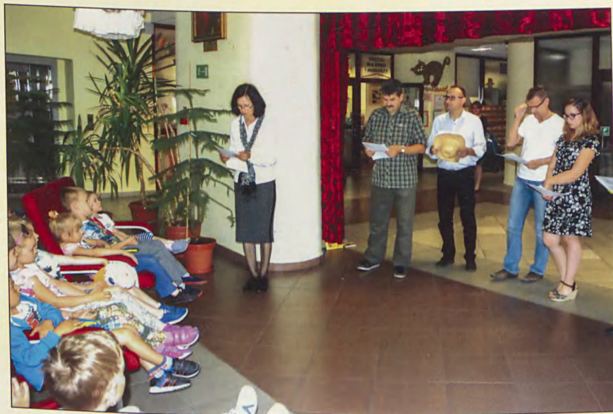
Bajka wielu lektorów – Tydzień Bibliotek w Książnicy Zamojskiej