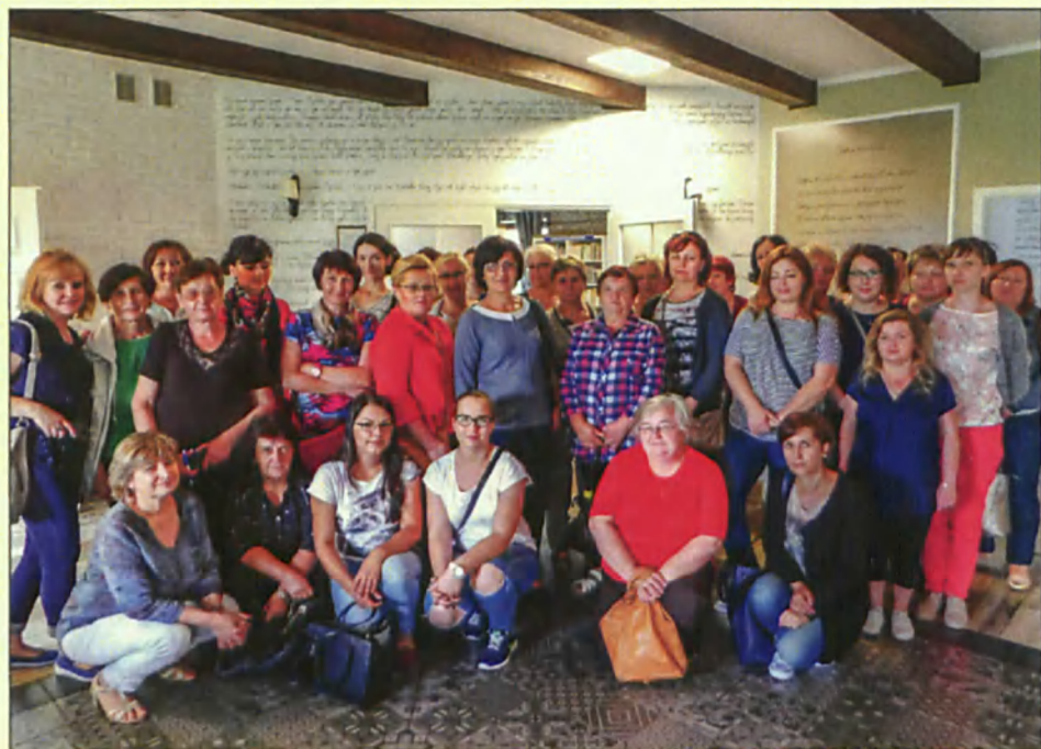
Wizyta zamojskich bibliotekarzy w bibliotece w Wytocznie