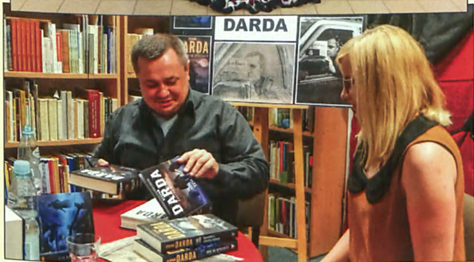
Noc Bibliotek w Książnicy Zamojskiej, BPG Zamość i BPG Łabunie