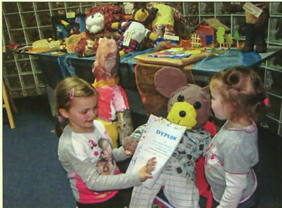
Finale rodzinnego konkursu Jestem sobie mały miś