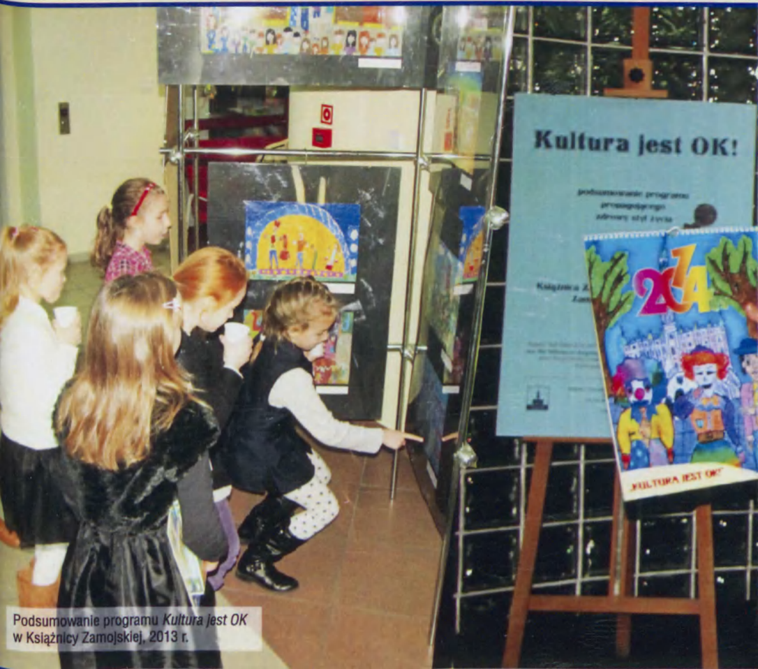
Podsumowanie programu Kultura jest OK! w Książnicy Zamojskiej, 2013 r.