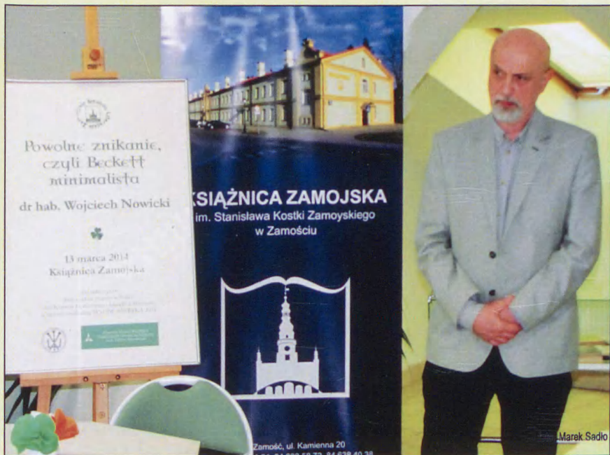
Spotkanie z literaturą irlandzką podczas Zamojskiej Biesiady Literackiej , 2014 r.