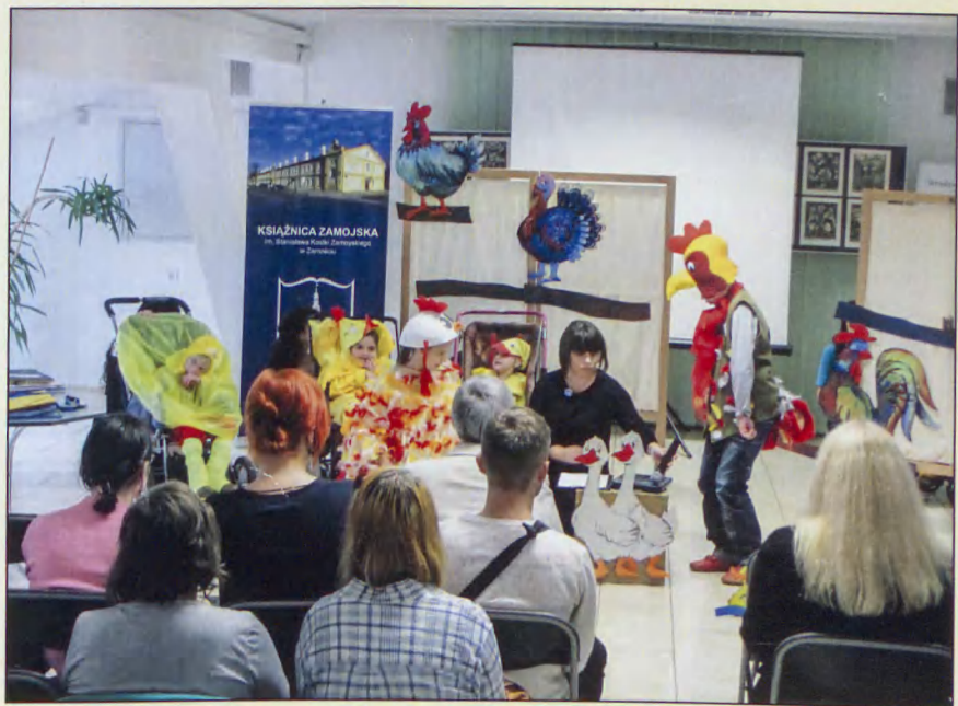
Inscenizacja w wykonaniu dzieci niemówiących w Książnicy Zamojskiej, 2013 r.