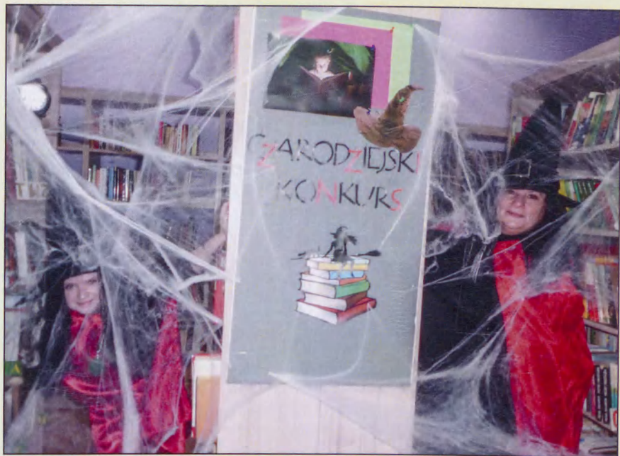
Czarodziejski konkurs w MGBP w Krasnobrodzie, 2013 r.