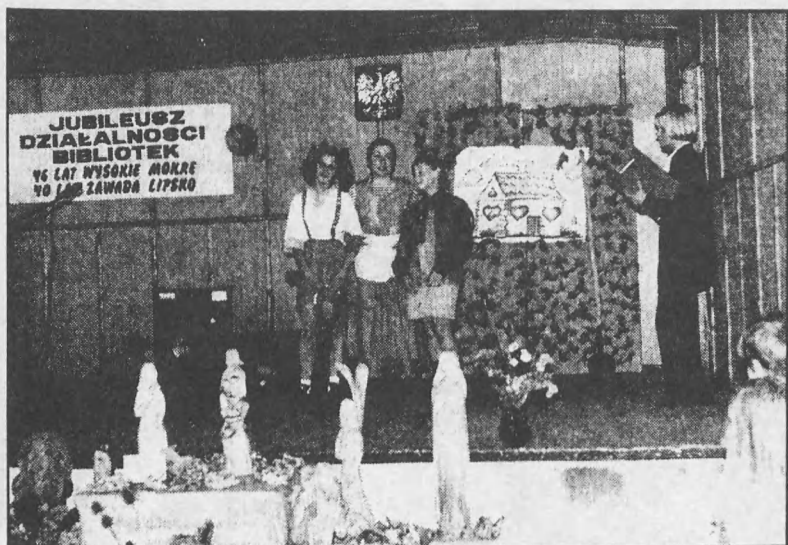
Współczesna sztuka "O Jasiu i Małgosi" w wykonaniu kółka teatralnego działającego przy FB Wysokie. U dołu fragment wystawy rzeźb p. Flisa z Siedlisk

Gminy Zamość przeprowadzono reorganizację bibliotek, polegającą na zmniejszeniu zatrudnienia w 6 bibliotekach.