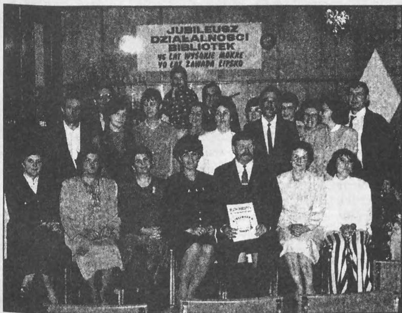
Przedstawiciele władz samorządowych i zaproszeni goście podczas jubileuszu bibliotek.

Wraz ze zmianami administracyjnymi struktury państwa, zmieniły się role i zadania bibliotek. Zaczęły funkcjonować jako podsta-